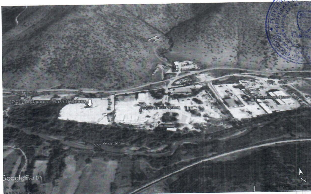
Микролокација на инсталацијата