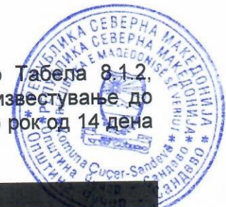
Табела 8.1.2: Програма за подобрување

8.1.1 Операторот ќе ги спроведе договорените мерки наведени во Табела 8.1.2, заклучно со датумот наведен во таа табела и ќе испрати писмено известување до Надлежниот орган за датумот кога било комплетирана секоја мерка, во рок од 14 дена од завршувањето на секоја од тие мерки